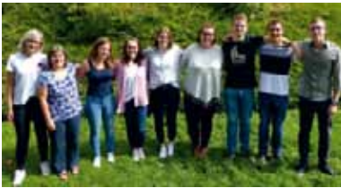
Unsere Zeitschenker 2018/19

Unserem Team stehen freundliche FSJ'ler, motivierte Mitarbeiter*innen und geschulte, zuverlässige Fachkräfte zur Seite. Wir decken Ihren Bedarf mit einem PKW oder einem Kleinbus. Fahrten mit Rolli sind kein Problem.